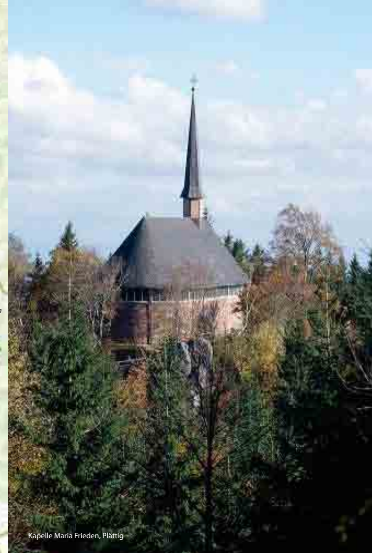
Kapelle Maria Frieden, Plättig